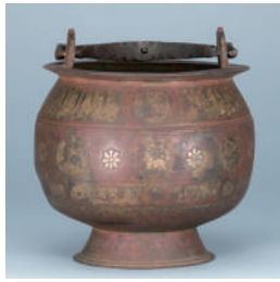
銀象嵌吊手付壺 12-13世紀 イラン 高30.4cm 岡山市立オリエント美術館