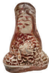
ラスタースター彩人物形瓶 12-13世紀 イラン 高12.4cm