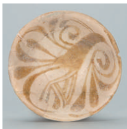
ラスタースター彩鳥文小皿 9世紀 イラク 径9.9cm 岡山市立オリエント美術館