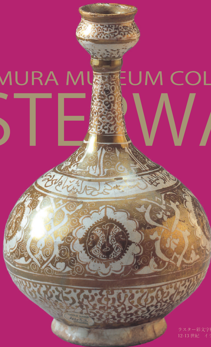
ラスター彩文字植物文柑子口瓶 12-13世紀 イラン 高19.7cm

SHIKOKUMURA MUSEUM COLLECTIONS LUSTERWARE