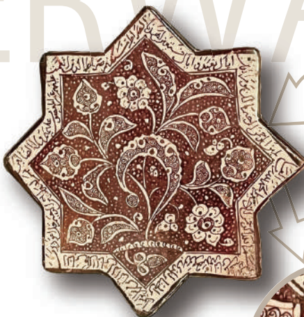
ラスタースター彩草花文星形タイル 12-13世紀 イラン 幅30.7cm

このたびの展示にあたり、専門家にアラビア文字銘文解読をお願いしました。大半の容器の銘文は解読不可能な「倣文字」でしたが、大型タイル2点にはコーランの一節が書き込まれていることが判明しました。さらに類例の検討から、このタイルがもともと貼り付けられていた聖廟が特定されました。