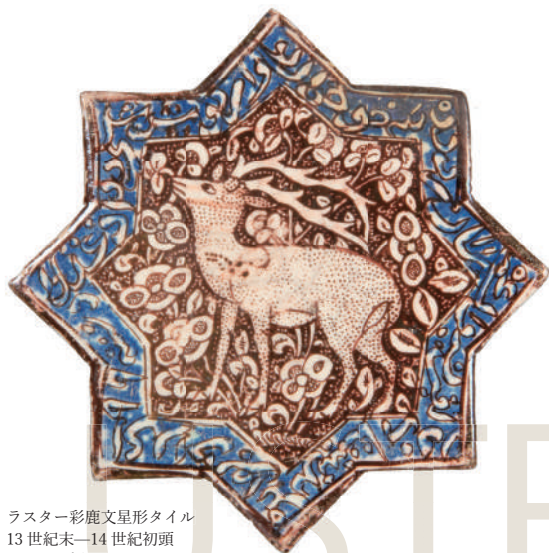
ラスタースター彩鹿文星形タイル 13世紀末-14世紀初頭 イラン 幅21.0cm 岡山市立オリエント美術館

本展では四国村ギャラリー所蔵の黄金期のラスタースター彩陶器25点を中心に、併せて岡山市立オリエント美術館所蔵の各時代・地域のラスタースター彩陶器や同時代の金属器も比較しながら紹介し、きらめきの魅力に迫ります。